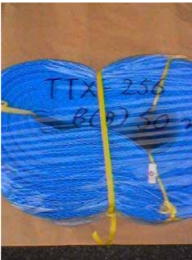
TTX - 256 B(B)

(規格) A : 500 \pm 20 mm B : 750 \pm 20 mm C : 290 mm (巻寸) : 50 m 重量 : 約 15.5 kg