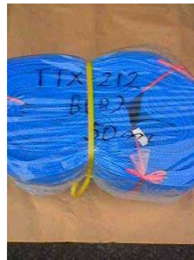
TTX - 212 B(B)

(規格) A : 400 \pm 20 mm B : 700 \pm 20 mm C : 330 mm (巻寸) : 50 m 重量 : 約 15 kg