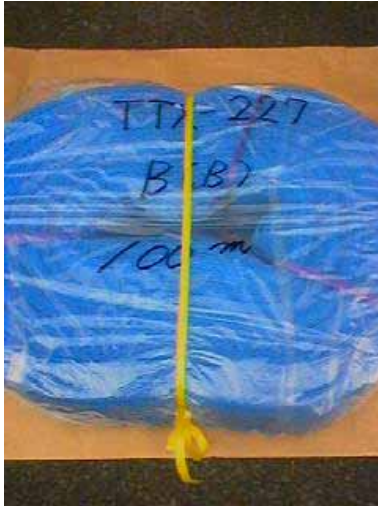
TTX - 227 B(B)

(規格) A : 700 \pm 20 mm B : 900 \pm 20 mm C : 190 mm (巻寸) : 100 m 重量 : 約 20.5 kg