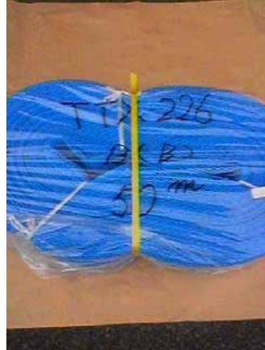
TTX - 226 B(B)

(規格) A : 450 \pm 20 mm B : 770 \pm 20 mm C : 260 mm (巻寸) : 50 m 重量 : 約 14 kg